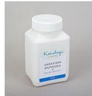
Kylpysuola 600g ph 7.5 29,00eur + postikulut